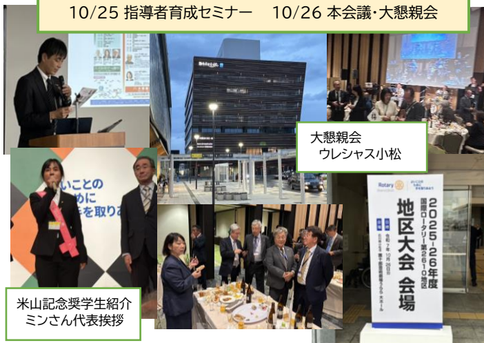
米山記念奨学生紹介 ミンさん代表挨拶

第2610地区 2025-26年度 地区大会の報告 10/25 指導者育成セミナー 10/26 本会議・大懇親会